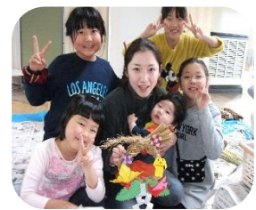
幼児クラブの赤ちゃんと一緒に しめ縄作りに挑戦。